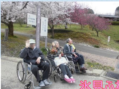
氷見ふれあいスポーツ センター付近にて