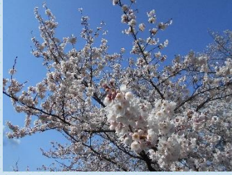
雨晴苑敷地内にて