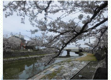
氷見 湊川 中の橋付近にて