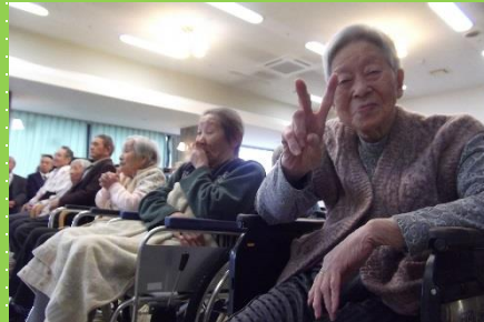
踊りの皆さんより みかんの贈呈