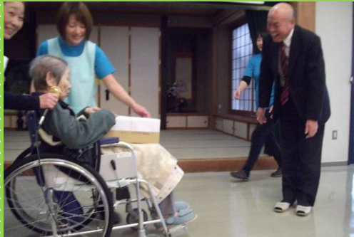
老人クラブより贈り物